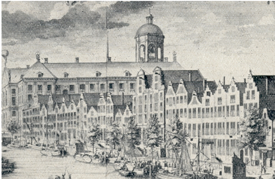
Uitsnede van een gravure van Henri de Leth uit de tweede helft der 18 e eeuw, rond 1770.

Welk gezin “nabij de Dam” in de Kalverstraat woont, zoals de aankoopakte van het ouderlijk huis vermeldt. Aan de achterkant van het blok waar Richard werkt en gaat wonen. Handig als je een kamer vlak bij je werk hebt, dacht ik eerst nog. Maar nog handiger, zo niet luier van als je dan ook je bruid maar meteen van om de hoek haalt. Maar dat was vast niet de invalshoek waarvan uit Adriana Christina en haar ouders het huwelijk beleefden. Nee, hun dochter trouwde een goede partij, zowel naar afkomst als naar geld. En met een toch zeer acceptabele baan.